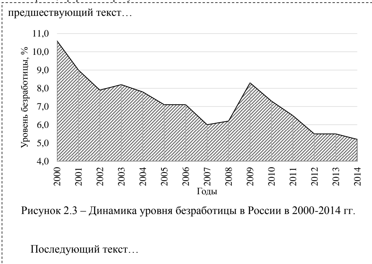
Рисунок 2.3 – Динамика уровня безработицы в России в 2000-2014 гг.